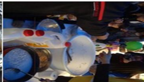
요리체험부스운영 ... 2011.09.27