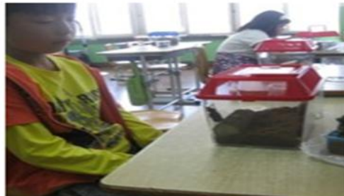
케익만들기 방문체... 2011.09.29