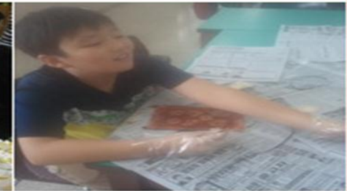
가족필통만들기 방... 2011.09.30