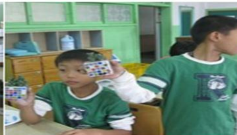
곤충사육통만들기, ... 2011.09.29