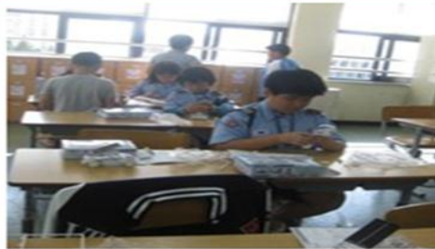
태양광 자동차만들... 2011.09.30