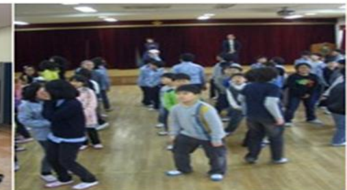
방송댄스 방문체험... 2011.09.26