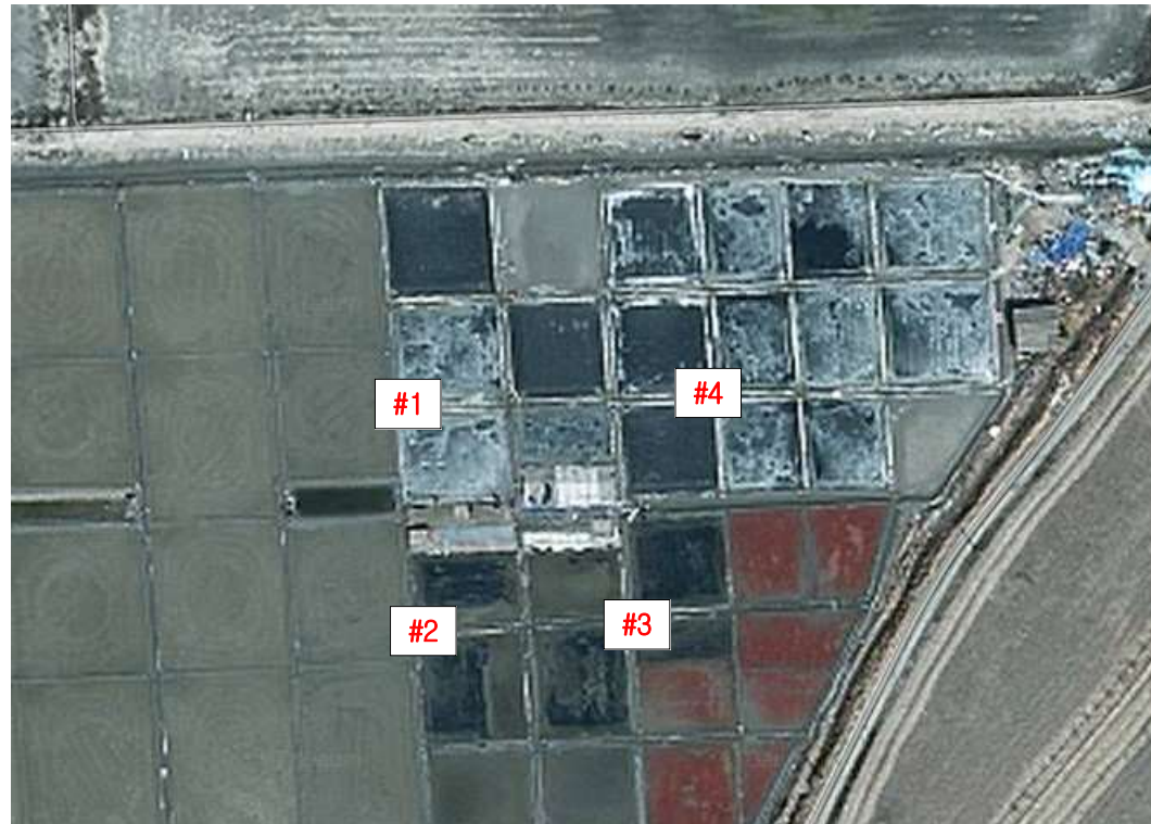
별첨 2). 측정 지점 위치도(도식도) - 염전 해주창고 부지경계선