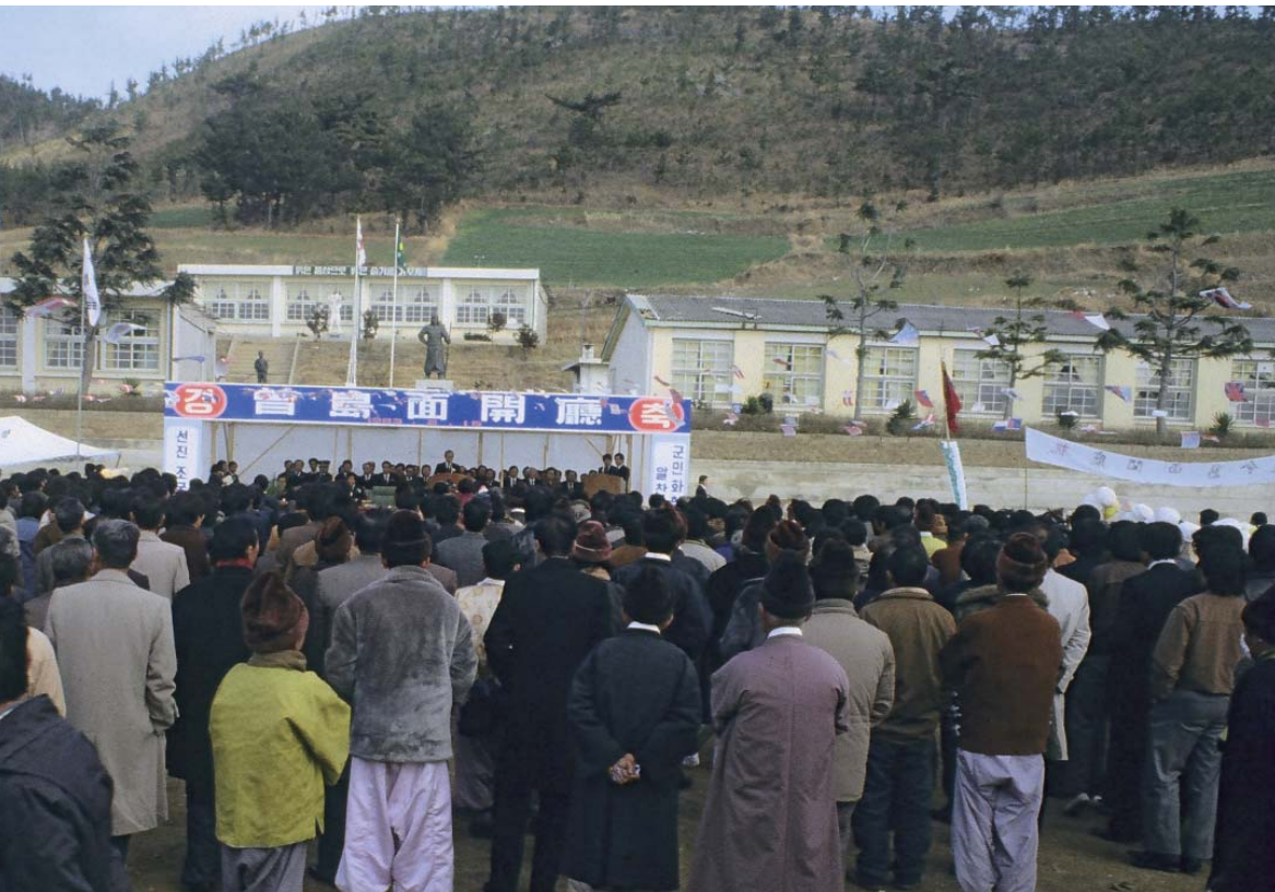
▶ 1983년 증도면 개청식 모습 (증도면과 팔금면, 신의면이 동시에 면으로 승격)