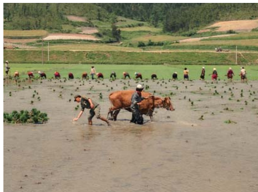
▶ 1970년대 손으로 하는 모내기 장면 '모타래(모뭍음)'를 소를 이용하여 나르는 모습