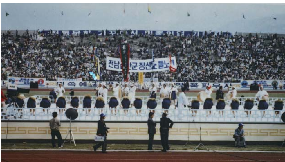
▶ 1982년 전국민속예술제에 출전한 장산들노래