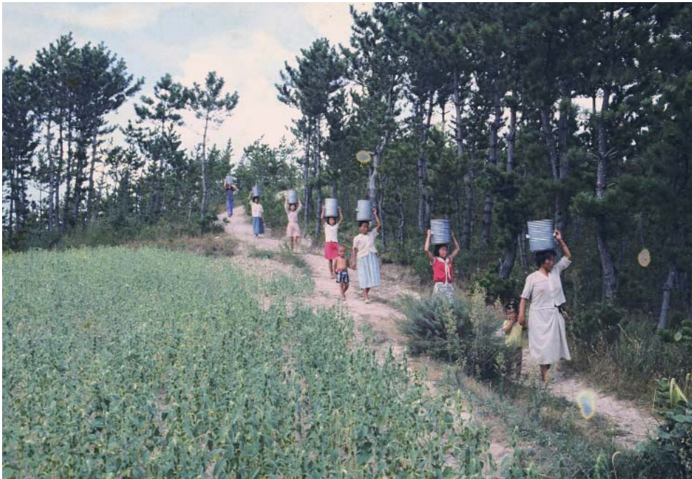
▶ 우물로 양동이를 이고 물을 이는 장면