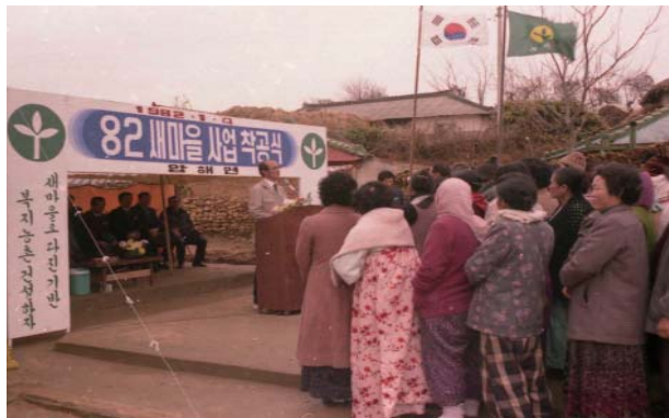
▶ 1982년 압해도에서 새마을사업 착공식을 하고 있는 모습