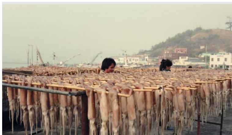
▶ 흑산도 오징어 건조 과정