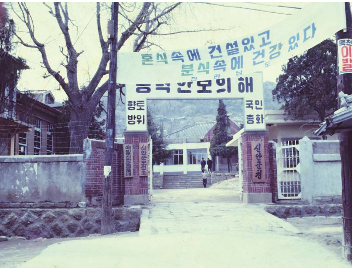
▶ 1969년 신안군이 창군 된 후 목포에 있던 군청사 모습 혼식 광고 현수막이 걸려있는 모습