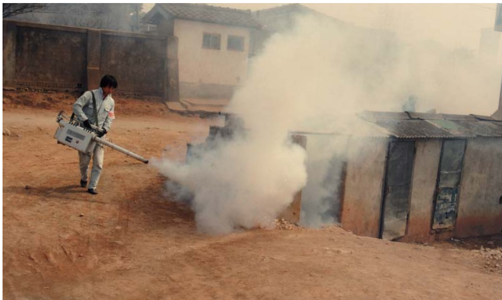
▶ 연막 소독기로 방제하고 있는 장면