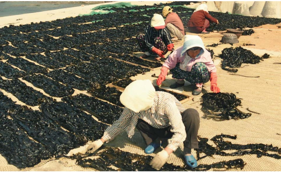
▶ 미역건조 장면