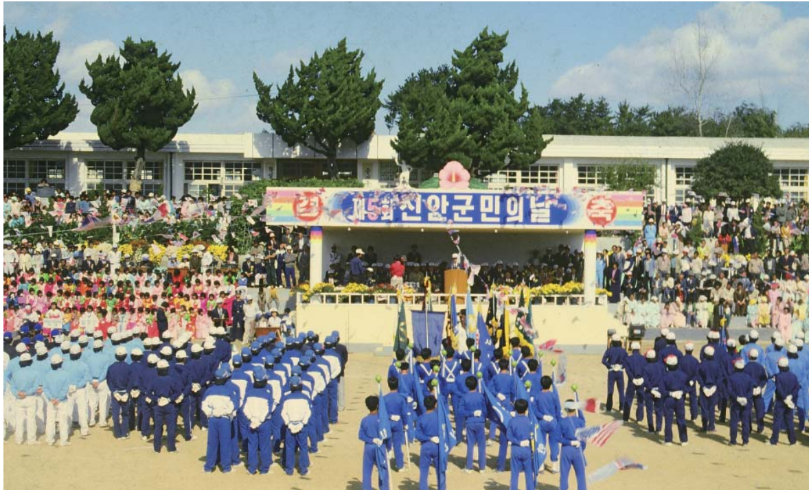
▶ 제5회 신안군민의 날