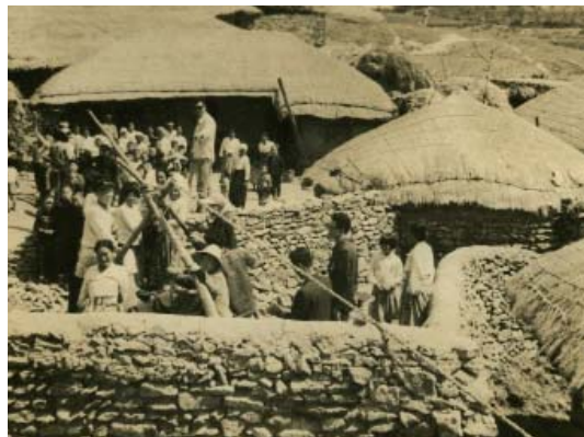
▶ 1960년대 말 비금 구기마을 한해사업 주민공동우물굴착장면