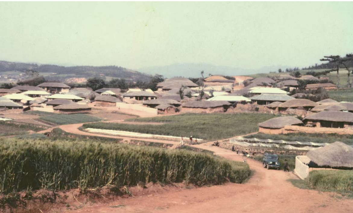
▶ 스텝지붕으로 개량이 시작 될 무렵 섬 마을 민가 풍경