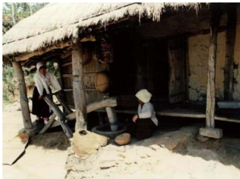
▶ 안좌도 연자방아