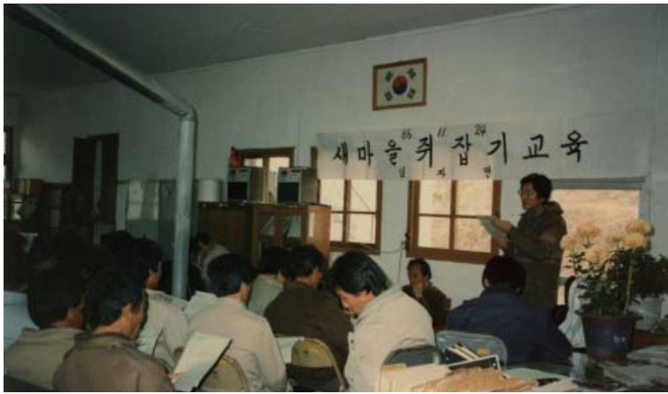
▶ 1986년 임자도 새마을취잡기 교육하고 있는 모습