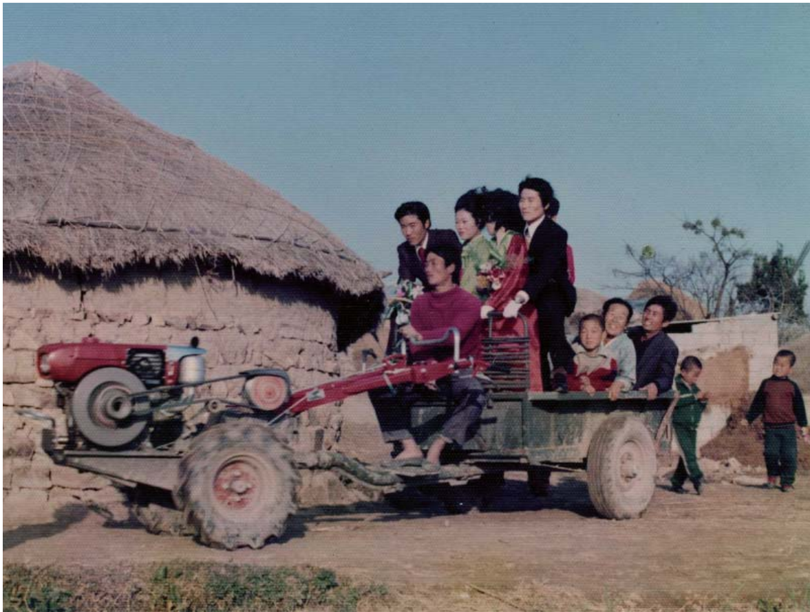
▶ 1970년 결혼식을 마친후 경운기를 타고 퍼레이드하는 장면