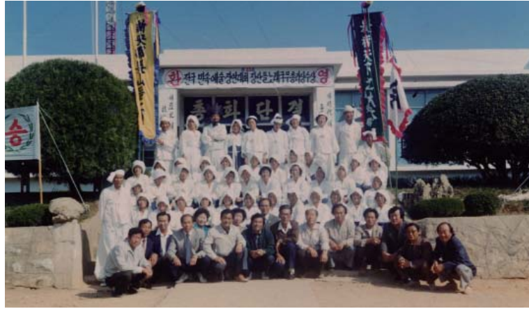
▶ 장산들노래 국무총리상수상 기념사진