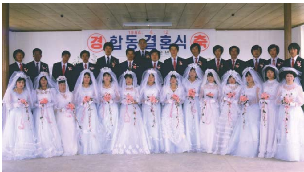
▶ 1984년 자은도 합동결혼식 장면