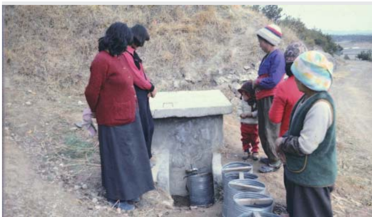
▶ 간이 상수도에서 양철동이를 이용해서 물을 받고 있는 장면