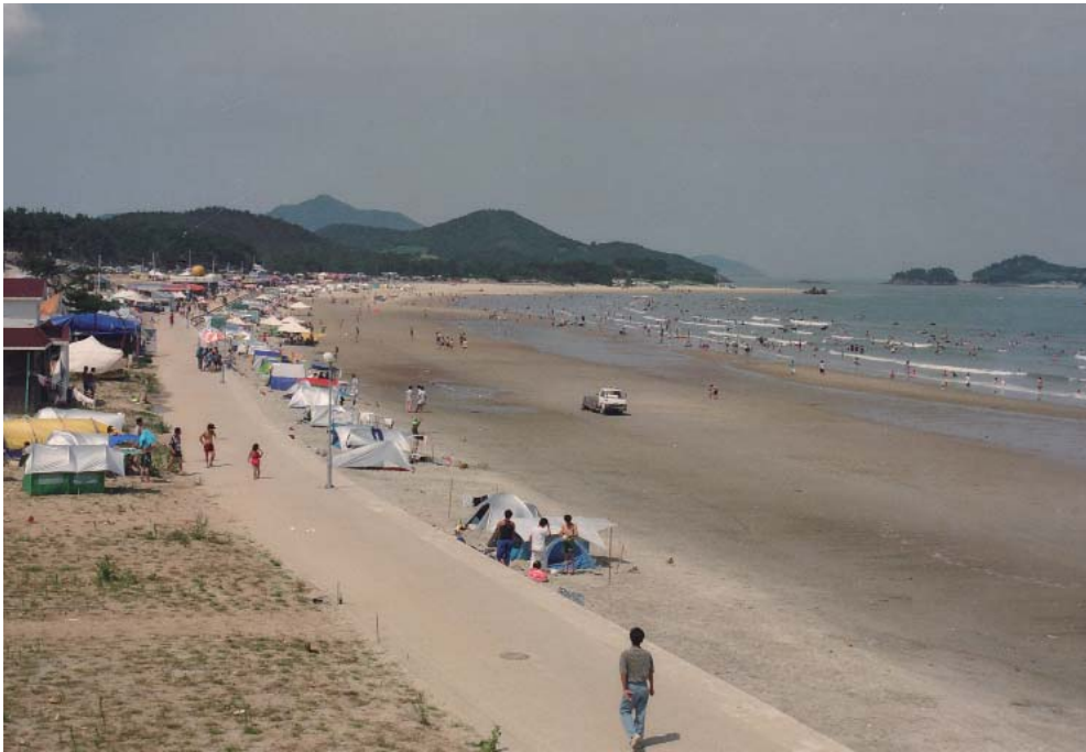
▶ 임자도 대광해수욕장의 옛모습