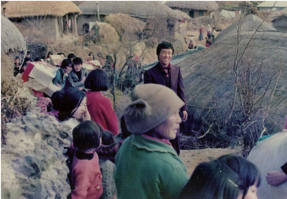
▶ 신부의 혼수품을 신랑 동네로 옮기고 있는 모습