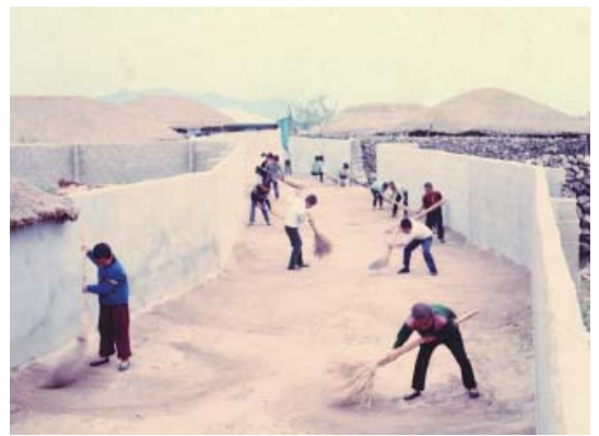
▶ 세계를 깜짝놀라게 한 증도 신안해저유물발굴 기념비