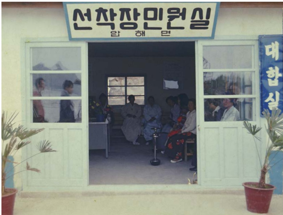
▶ 압해도 신장리 선착장 대합실의 옛 모습