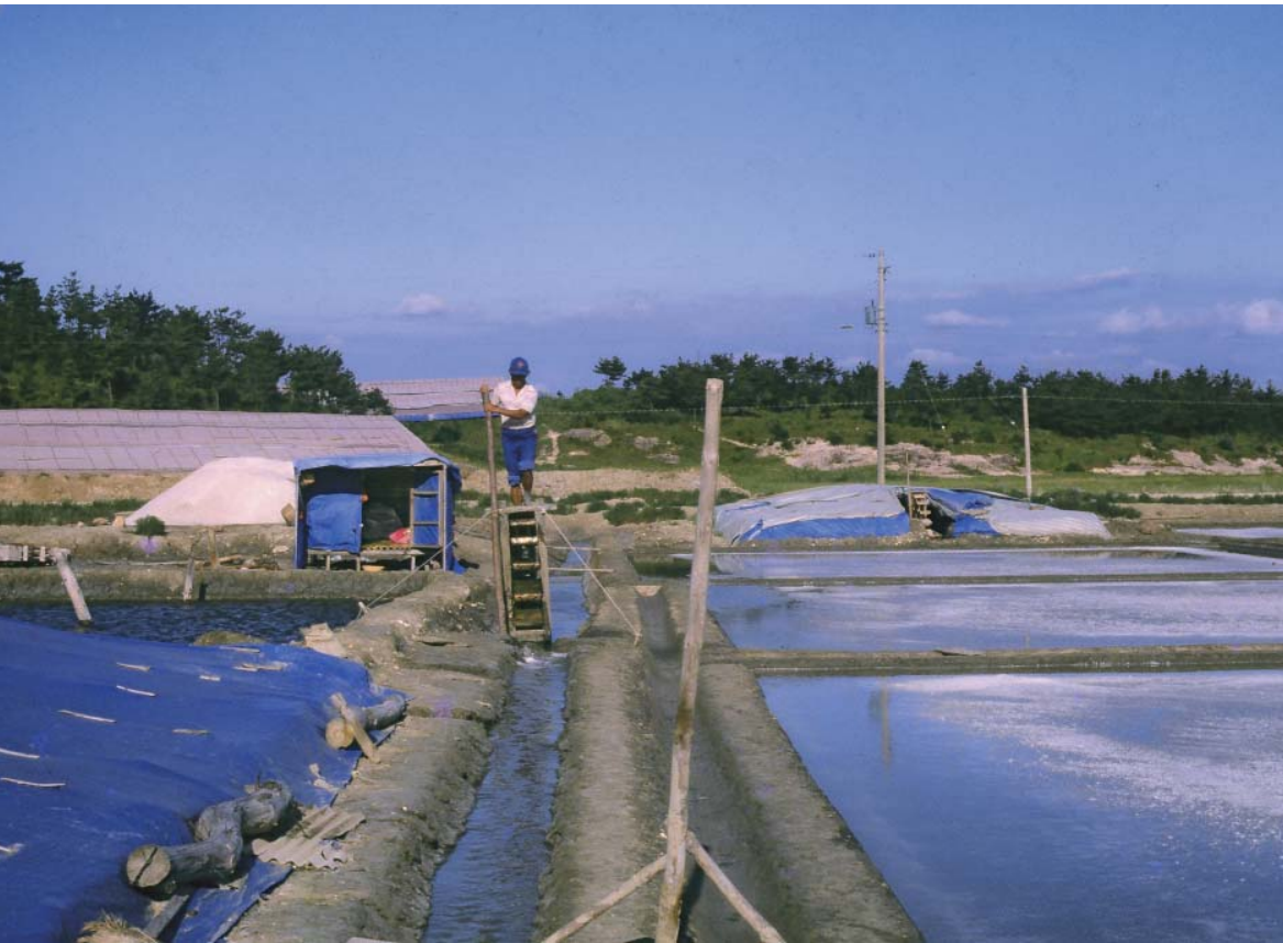
▶ 염전에서 수차를 이용하여 함수를 결정지에 보내고 있는 모습