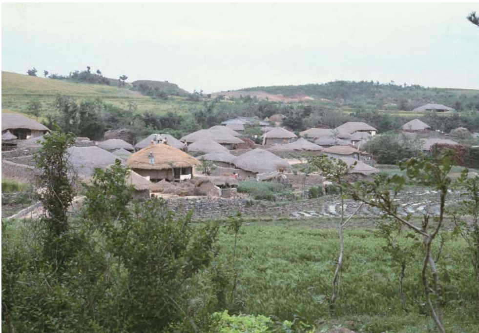
▶ 신안 섬마을의 옛 민가(초가지붕의 이영을 새로 열고 있는 모습)