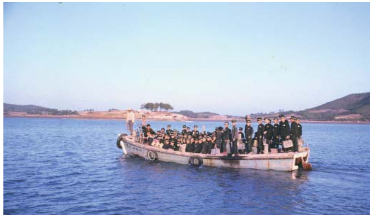
▶ 학생들이 통학하는 장면(작은섬에서 큰섬으로 통학하는 중학생들)