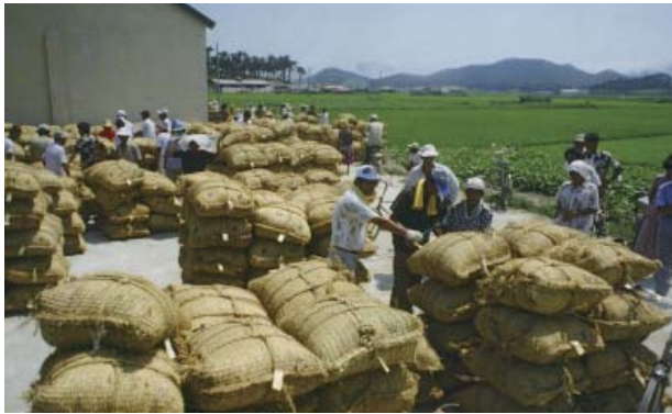
▶ 1980년대 초반 보리 수매 장면