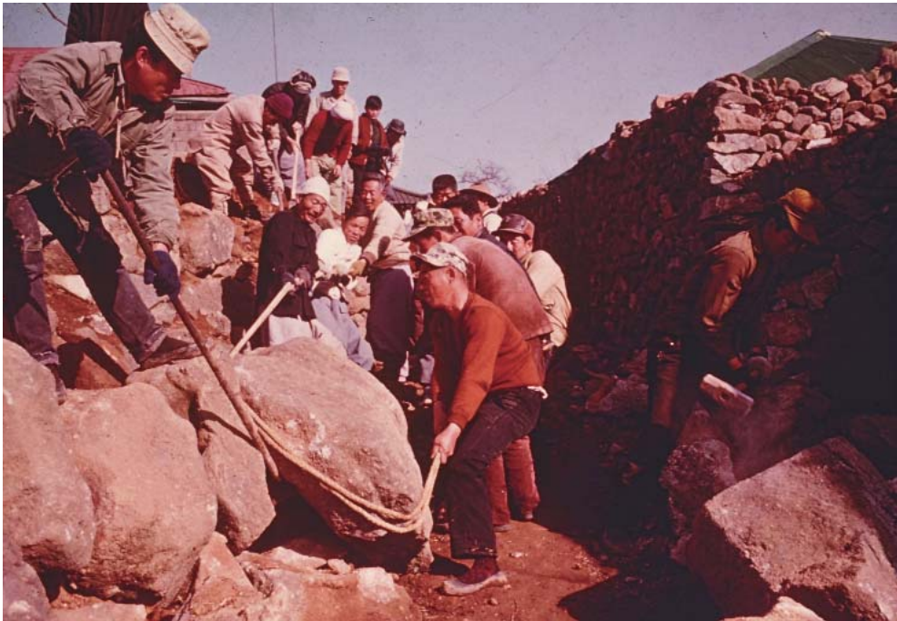
▶ 마을길 조성을 위해 주민들이 석축을 줄로 묶어서 인력으로 축조하는 모습