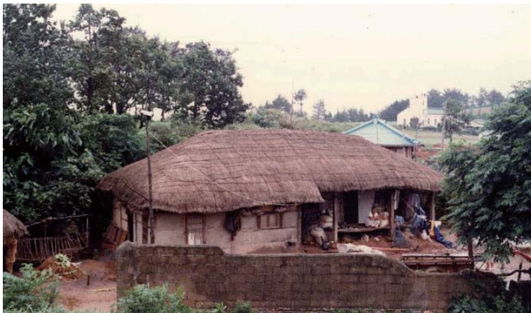
▶ 1986년도 지도 내양리 민가 형태