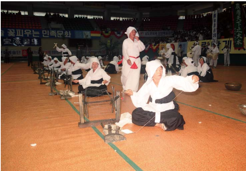
▶ 장산 길쌈노래. 출연진들 시연하는 광경