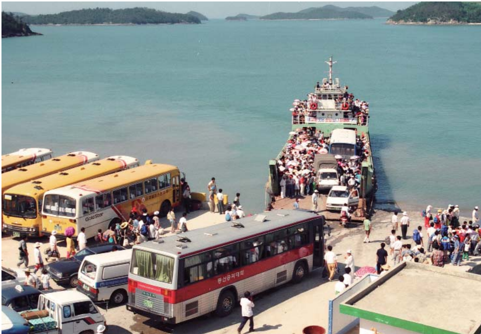
▶ 임자도로 가는 철선을 타기 위해 지도 점암선착장에 모여든 인파