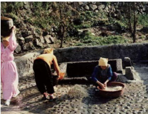
▶ 안좌도 마을 공동우물