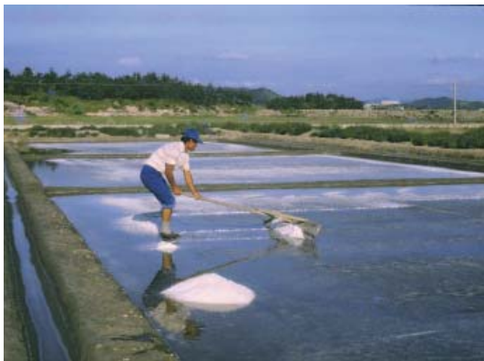
▶ 1970년대 대파를 이용하여 소금을 굽고 있는 장면