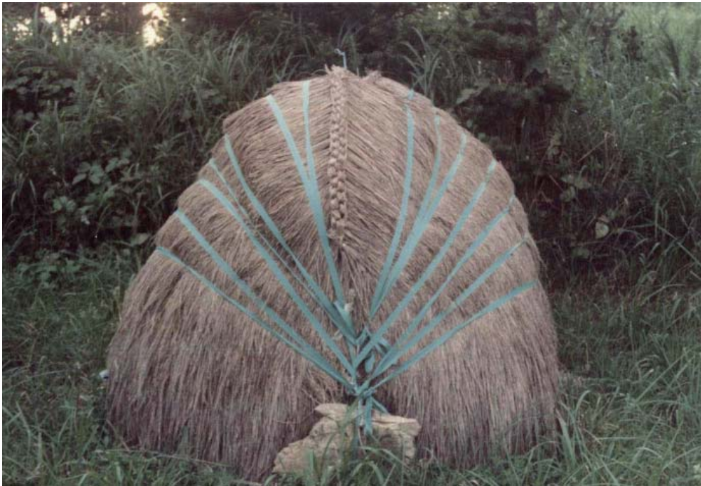
▶ 섬 사람들의 독특한 무덤 양식인 초분